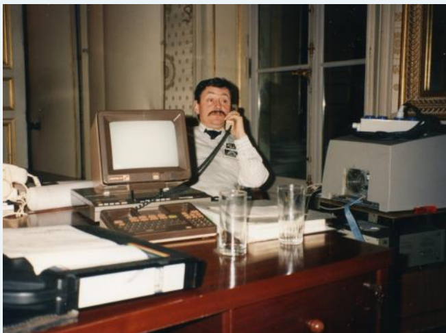
A l'Elysée en 1989 pour une démonstration du Minitel