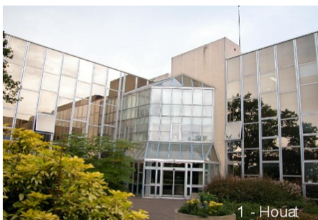
1 - Houat

transpac la solution sur Rennes Atalante