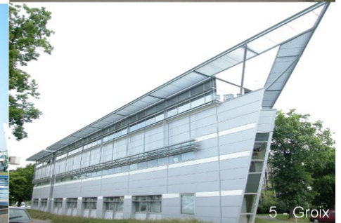
5 - Groix