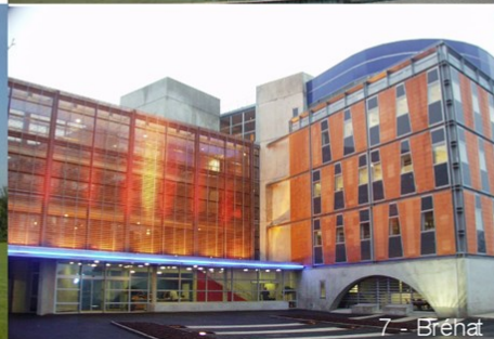
7 - Bréhat