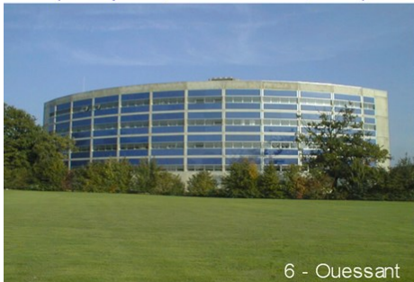
6 - Ouessant