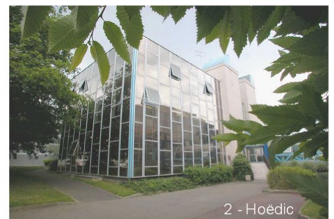
2 - Hoëdic

transpac la solution sur Rennes Atalante