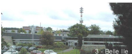
3 - Belle Ile