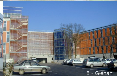
8 - Glénan