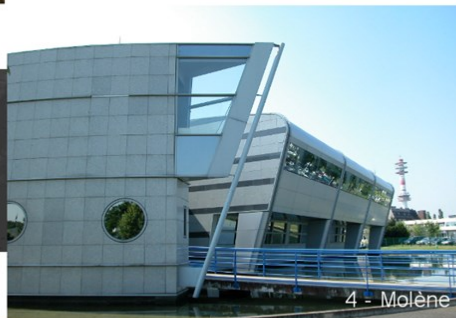
4 - Molène